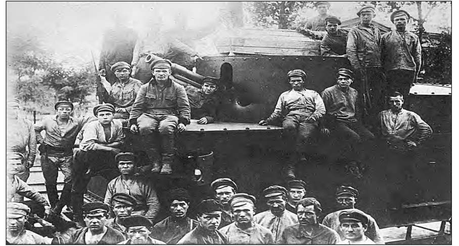
Ejército Rojo durante la guerra civil sobre los blindados

La eliminación de comandantes con experiencia y capacidad militar y su reemplazo por oficiales leales pero inexpertos, carentes de iniciativa y pésimos estrategas como Voroshilov, sumada a la desorganización general de las filas del Ejército, tendrían consecuencias desastrosas a la hora de enfrentar la invasión alemana de la URSS. Los nuevos jefes militares