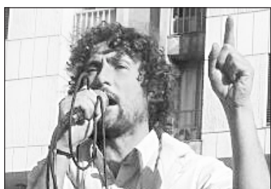
Escribe Ezequiel Peressini Legislador de Izquierda Socialista en el Frente de Izquierda

En una escandalosa sesión legislativa, vallada y custodiada por infantería, perros y bomberos, entre gallos y medianoche y sin previa discusión, se aprobó una ley, que bajo el pretexto de garantizar los servicios "esenciales" busca cercenar el derecho de huelga.