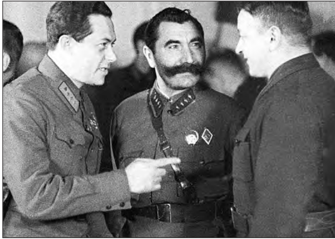
De izquierda a derecha, los líderes militares soviéticos Semyon, Budenny y Tukhachevsky durante la Guerra Civil Rusa

Una vez liquidada política y físicamente la "Vieja Guardia", Stalin impulsó secretamente, a mediados de 1937, la eliminación de la oficialidad mayor del Ejército Rojo, con