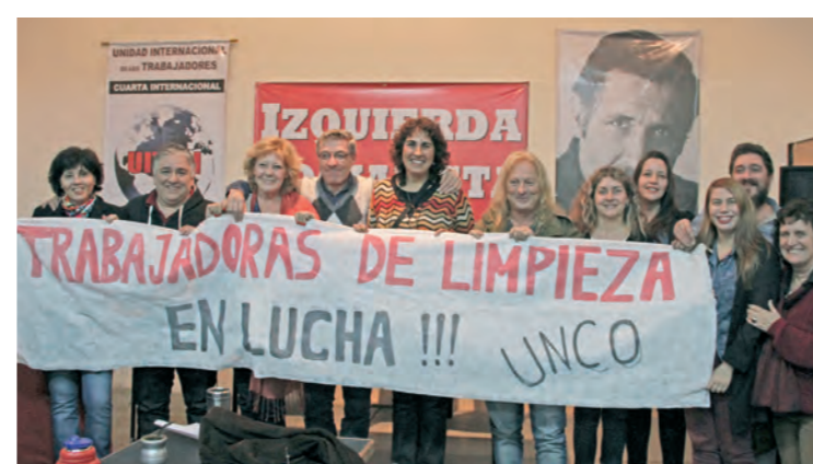
Candidatas de varios distritos solidarizándose con las trabajadoras despedidas de la Universidad Nacional del Comahue