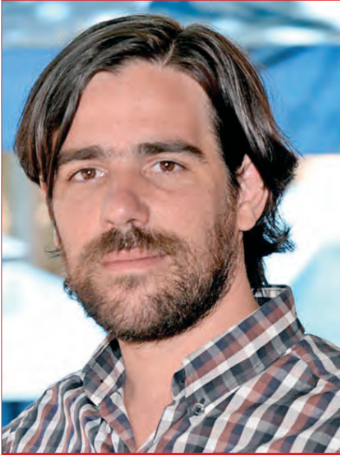
Nicolás Del Caño PTS