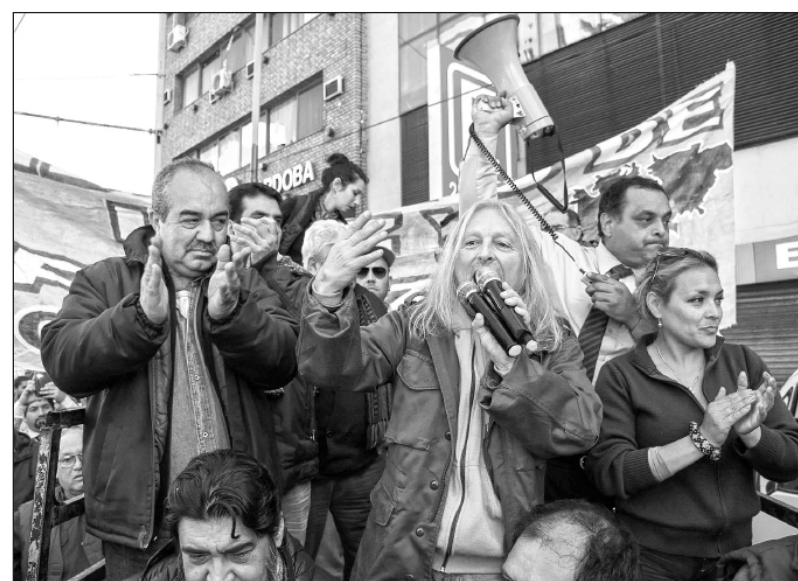
Sobrero solidarizándose con los choferes

Cuando se anunció la llegada de Rubén "Pollo" Sobrero a Córdoba, cuya presencia era reclamada por los dirigentes del conflicto, los medios adeptos al gobierno decían que lo hacía para "alterar la paz social". Pero el intento de demonizarlo no prendió. Su presencia como parte del sindicalismo combativo sirvió para dar una connotación nacional a la lucha, por eso las expectativas y el conmovedor recibimiento de los trabajadores. Habló en todos los actos que se realizaron, hizo innumerables entrevistas en los medios y hasta una numerosa reunión con activistas sindicales en el local de Izquierda Socialista, y