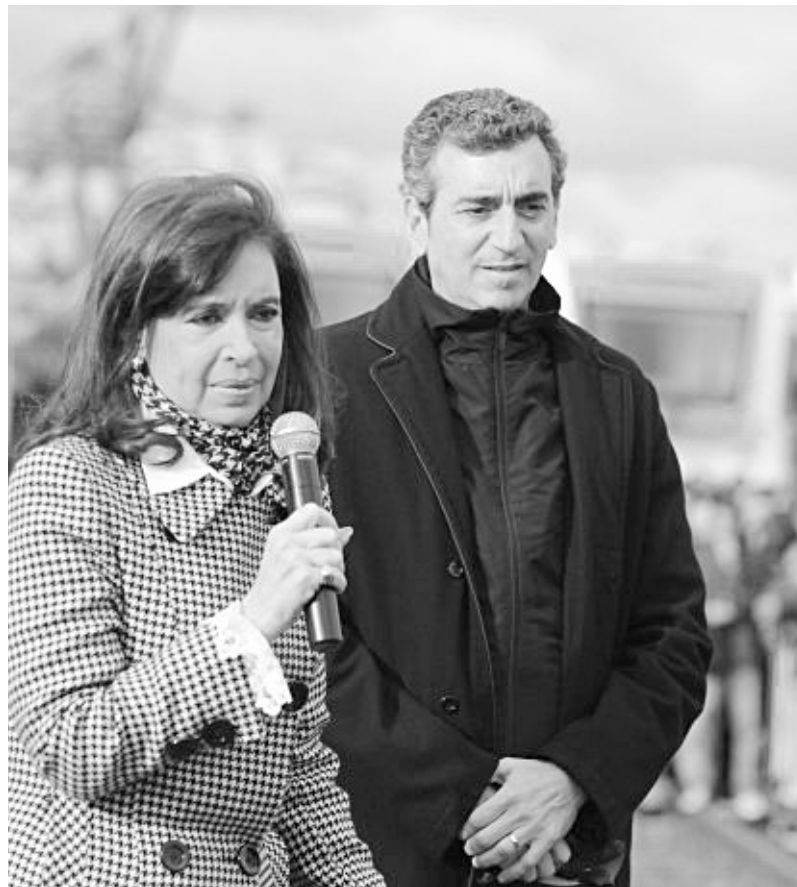
Cristina y Randazzo en otros tiempos

Además a lo largo de este año y medio de gobierno macrista, fue el peronismo en todas sus variantes quien le garantizó las principales leyes para que se desarrolle el ajuste: así, el pago a los fondos buitres y el presupuesto de este año no hubieran salido sin la ayuda inestimable del Frente para la Victoria en senadores y diputados, donde el macrismo es minoría. A esto agreguémosle que los propios dirigentes sindicales peronistas (y dentro de ellos los kirchneristas) fueron fundamentales para garantizarles la tregua al gobierno antes y después del paro general del 6 de Abril. Un ejemplo de esto fue Baradel y su entrega del conflicto docente en la provincia de Buenos Aires.