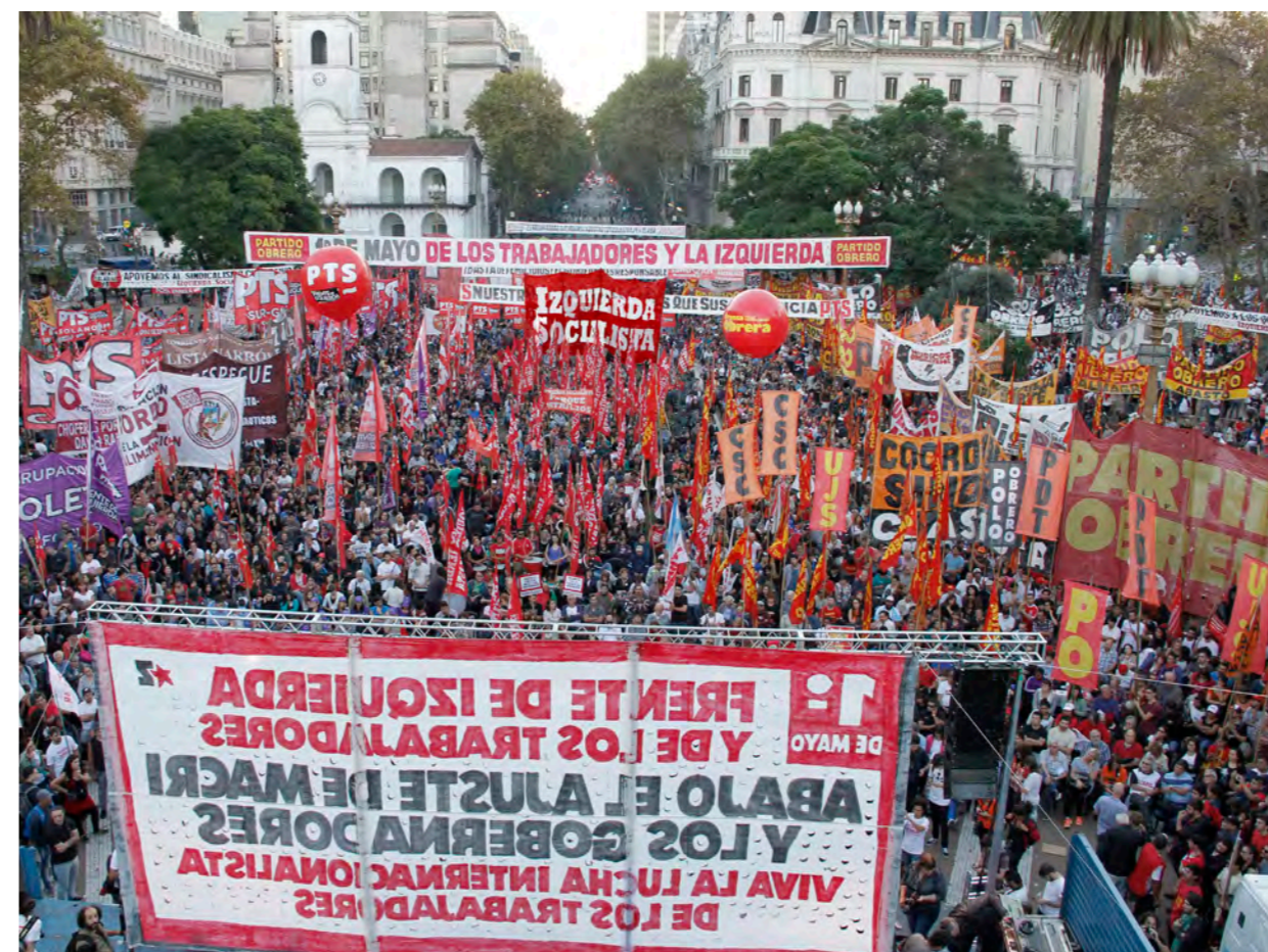
Acto unitario por el 1° de mayo en Plaza de Mayo

Planteando además que, frente a todos los candidatos del ajuste, hay que votar para meter más diputados del Frente de Izquierda, porque son los que van a seguir estando al servicio de todas y cada una de las luchas, y continuarán cobrando lo mismo que una maestra, rechazando los privilegios y sueldos millonarios que se otorgan a sí mismos los legisladores.