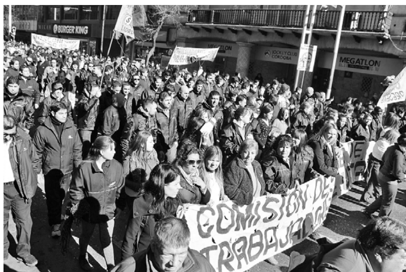
Marcha de los choferes

para dividir a los usuarios de los choferes y sus medidas de fuerza. A partir de esto, y a pedido de Schiaretti y Mestre, el burócrata de la UTA nacional, Fernández, impuso un interventor en la seccional.