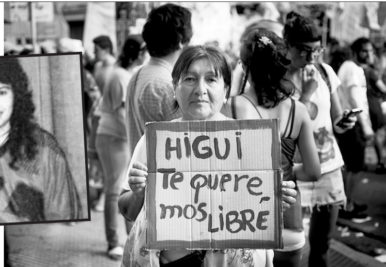
Reclamo por la libertad de "Higui"