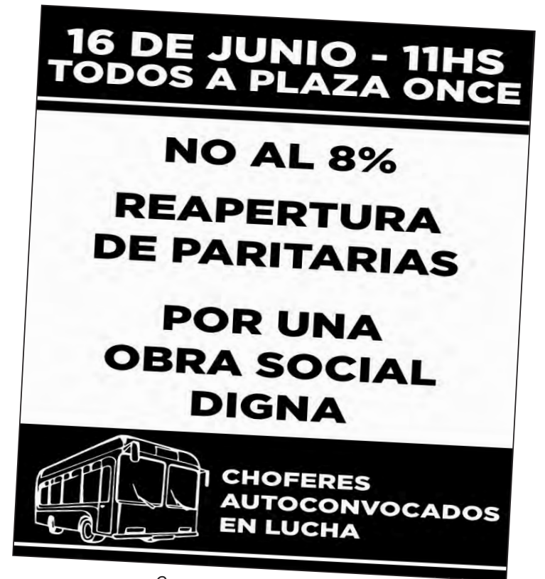
Convocatoria de los choferes