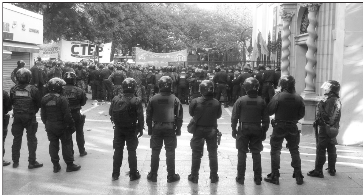
La Legislatura de Córdoba militarizada

Abrazamos con nuestra solidaridad a los choferes y operadoras de trolebuses, que seguirán luchando al igual que el resto de los trabajadores.