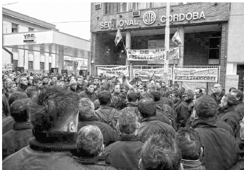
Concentración frente a la sede de UTA Córdoba

La UTA Córdoba desde hace más de una década viene siendo conducida por distintos recambios burocráticos, en conflicto permanente con la UTA central, defendiendo en cada caso su propio feudo. Hay una base muy explosiva, que en los últimos años salió a numerosos paros espontáneos rebasando a sus conducciones. Las patronales y el gobierno incentivaron una campaña