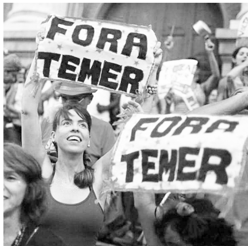
Una de las manifestaciones contra Temer

La Corriente Socialista de los Trabajadores (CST, sección de la UIT-CI y corriente del PSOL), plantea que hay que derrotar las reformas